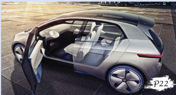
大众 I.D. 展示车，第一款基于 MEB 模块化电力驱动汽车平台的车型