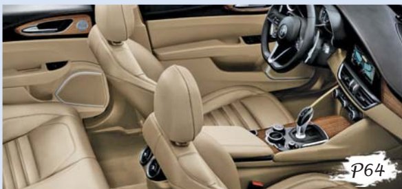
阿尔法·罗密欧 Giulia 内饰