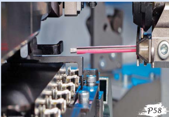
TE 可靠高效地 LITEALUM 压接技术为铝吧—铝线连接方案提供保障